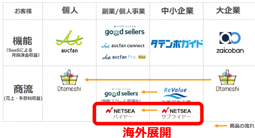
【オークファングループの提供サービス】

オークファングループは、創業来培った売買データと AI 技術により商品の時価を可視化し、企業在庫の価格と販路を最適化する予測モデルを構築しており、中小企業・副業/個人事業主を中心とした小売・流通業向けのトータル EC 支援ソリューションを展開しております。