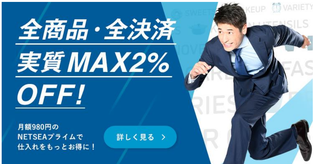
仕入れの「加速」をイメージした「NETSEA プライム」のメインビジュアル

NETSEA のバイヤー会員の特征の一つとして、入会費・月会費無料ですべての機能を利用することができます。「NETSEA プライム」のサービス開始後もこれら既存の機能は引き続き無料にて利用することができます。「NETSEA プライム」はバイヤー様がよりお得に仕入れができるようにするためのサービスメニューであり、いつでも加入・停止が可能です。